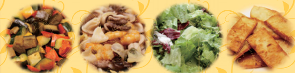
【イメージ写真】トッピング、サラダ、ナン