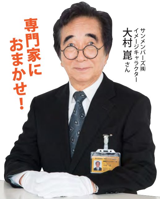
サンメンバース(株) イメーシキョウクター 大村 崑さん