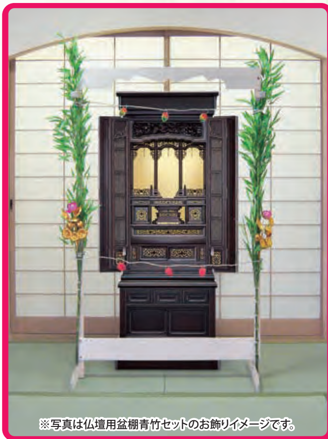
※写真は仏壇用盆棚青竹セットのお飾りイメージです。

サイズ／高さ170×幅103×奥行き40cm お仏壇適合サイズ／高さ156×幅92cmまで（扉を開いた状態）