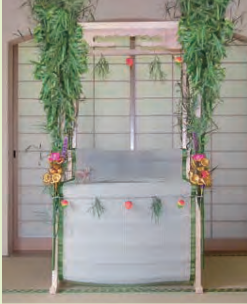
1-01 レギュラーサイズ