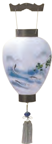
5-06 絹 涼翠神代杉 絹二重張 サイズ/高さ48.0cm 〈LED電池灯〉[6022] 21,000円(税込)