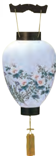
5-03 紙 天上長浜紫檀 サイズ/高さ46.0cm 〈電球電池灯〉[5453] 11,500円(税込)