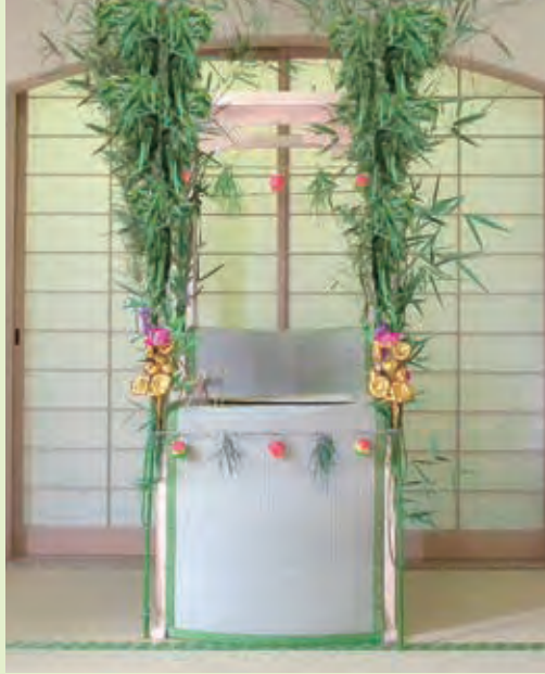
1-02 コンパクトサイズ 数量限定