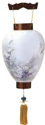
5-07 絹 天上本桜絹 二重張手描き絵 サイズ/高さ46.0cm 〈LED電池灯〉[5950] 22,400円(税込)