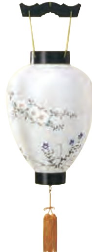
5-05 絹 別上黒檀調 絹張手描き絵 サイズ/高さ46.0cm 〈電球電池灯〉[5750] 14,600円(税込)