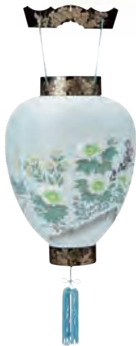
5-02 紙 極上蒔絵 サイズ/高さ46.0cm 〈電球電池灯〉[5150] 7,500円(税込)