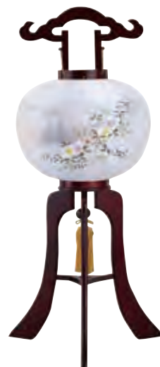
5-GN 絹 根尾楡ワイン絹二重張 サイズ/高さ87.0cm 〈電気コード式〉[71511] 21,800円(税込)