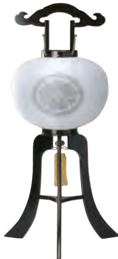
5-GK 絹 黒檀白絹二重張家紋入 サイズ/高さ87.0cm 〈電気コード式〉[11416] 37,300円(税込)