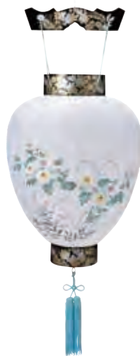
5-04 紙 大極蒔絵 サイズ/高さ46.0cm 〈電球電池灯〉[5220] 11,600円(税込)