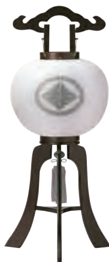
5-GS 絹 紫檀白絹二重張家紋入 サイズ/高さ87.0cm 〈電気コード式〉[11836] 36,100円(税込)