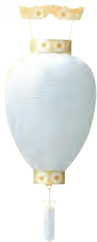
5-01 紙 紋天柩(無地) サイズ/高さ44.0cm 〈電球電池灯〉[5202] 6,400円(税込)

御所(軒下げ)提灯 ご先祖様へご供養のかたちとして 地域によっては新盆にかぎり白無地の提灯をお飾りします