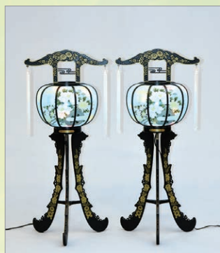
B-1 牡丹 高さ95cm 1対 13,200円 (税込)