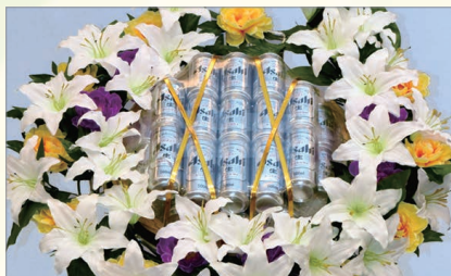
M-2 盛籠 ビールセット 1基 13,200円(税込)