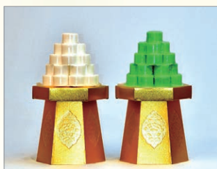
G-2 盛菓子* 上白糖 高さ約41cm 1対 7,560円 (税込)