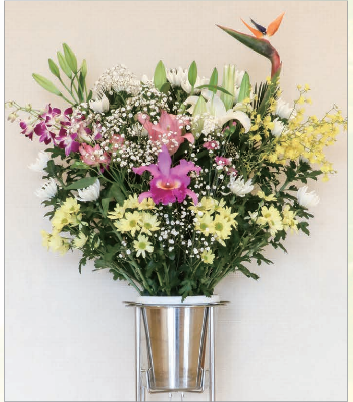
F-2 スタンド生花 1段C

輪菊・百合3種・カーネーション・アルストロメリア・SPマム・オレンジウム・デンファレ