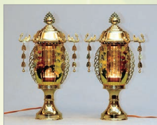
T-1 菊華灯 高さ38cm 1対 13,200円 (税込)