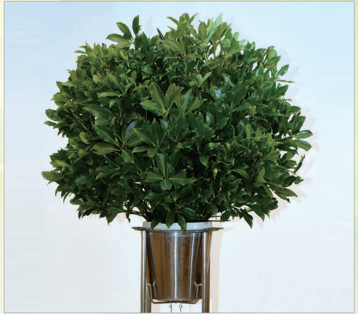
O-1 スタンド檜1段 1基 13,200円(税込)