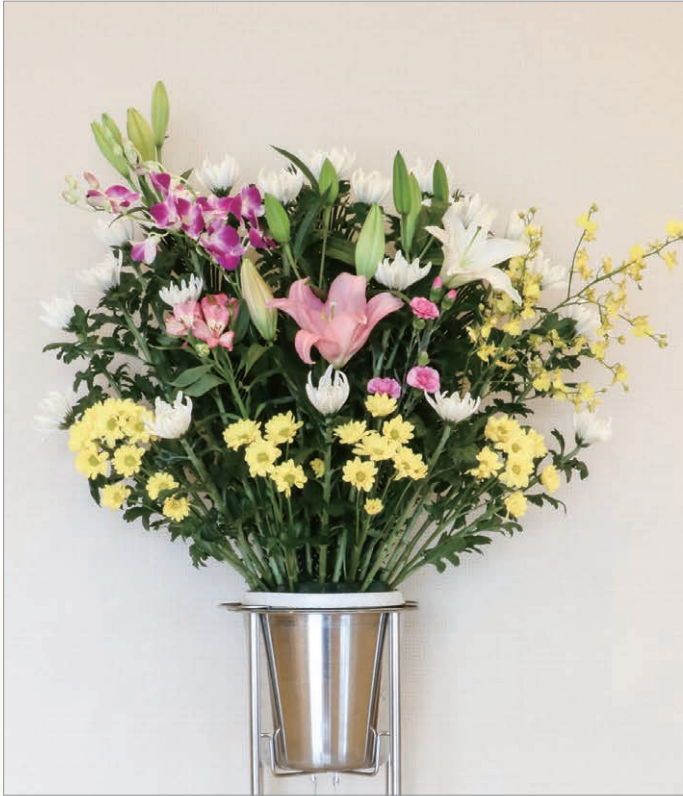
F-1 スタンド生花 1段B