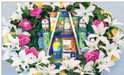
M-4 盛籠 調味料セット* 1基 10,800円(税込)