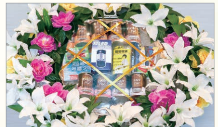
M-5 盛籠 防災セット* 1基 10,800円(税込)