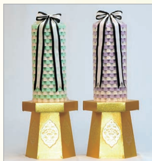
G-1 楽願塔* スティックシュガー 120本入り 高さ約62cm 1対 16,200円 (税込)