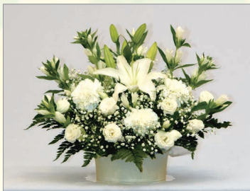
A-1 枕飾り生花(小) 1基 5,500円(税込) 高さ約35cm 横約35cm