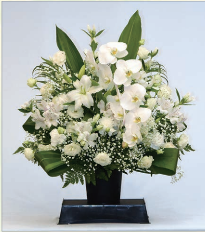
A-2 枕飾り生花(大) 1基 11,000円(税込) 高さ約60cm 横約60cm