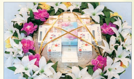
M-3 盛籠 線香セット 1基 11,000円(税込)