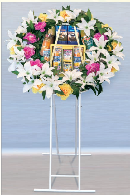
M-1 盛籠 缶詰セット* 1基 10,800円(税込)