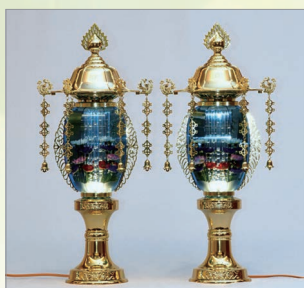
T-2 水明灯 高さ62cm 1対 16,500円 (税込)