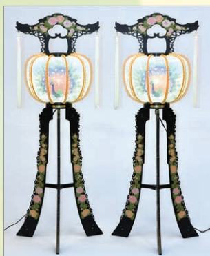
B-2 ひまわり1号 高さ115cm 1対 16,500円 (税込)