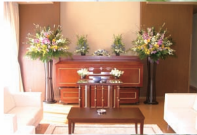
家族室でリビング葬も可能です